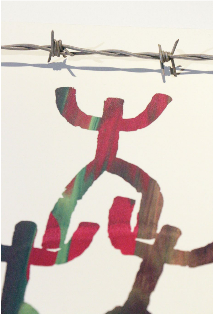
Var2 (2026): inklusive Stacheldraht