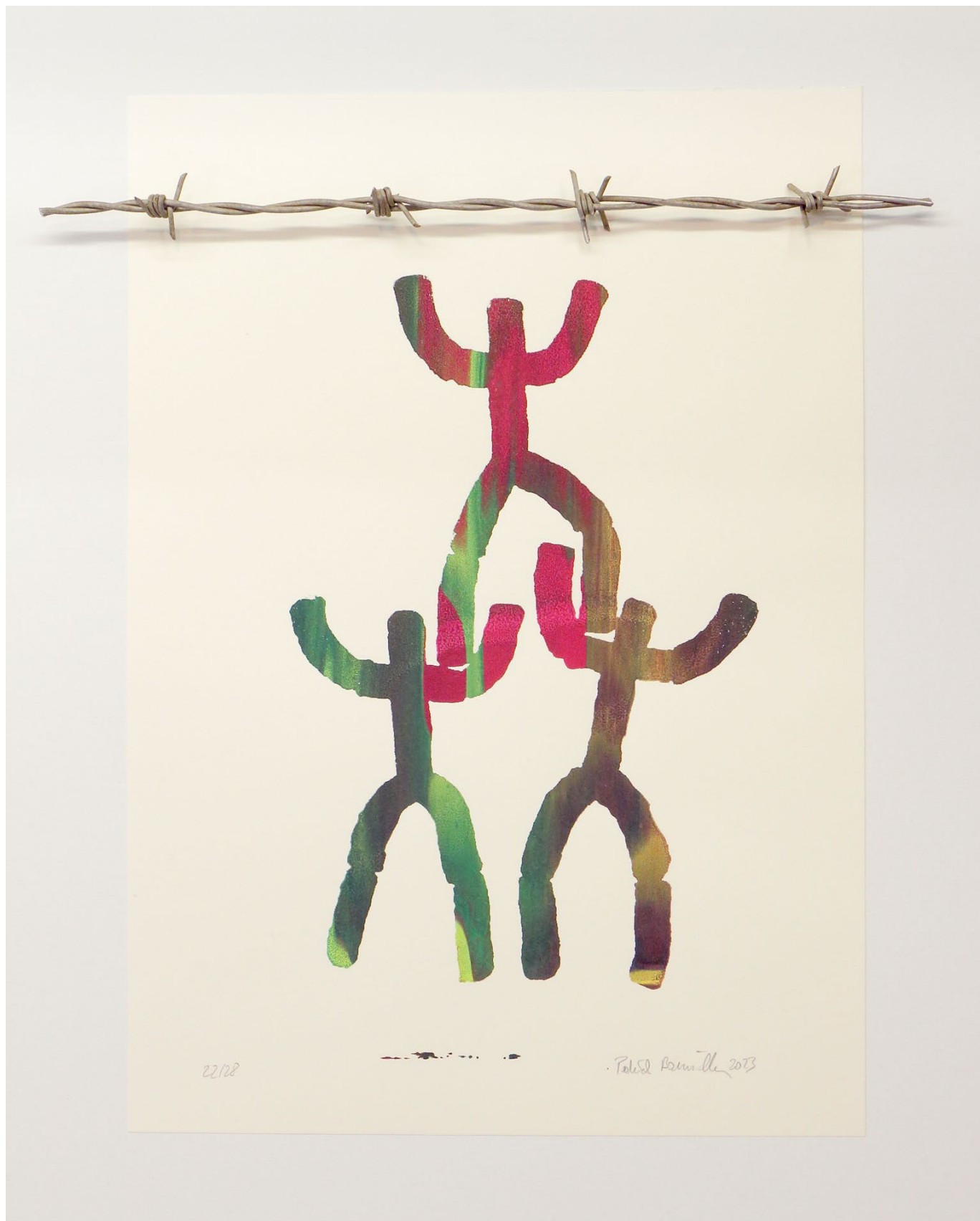
Var2 (2026): inklusive Stacheldraht