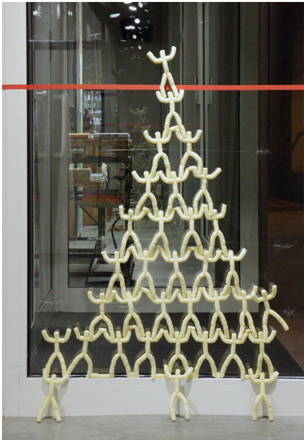
Installation gesamt: Menschenturm