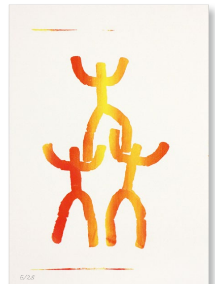
Farb-Varianten der Siebdruckserie